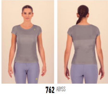
Loma Evo T-shirt

A cela on a retenu d'autres pièces d'été (veste de pluie), tee-shirt sans manche, différents shorts (tout sera sur commande individuelle). Pour les vêtements d'hiver on repart sur la même gamme des années précédentes. Olivier doit nous envoyer une proposition.